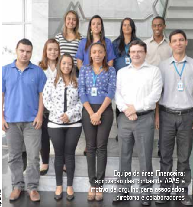
Equipe da área Financeira: aprovação das contas da APAS é motivo de orgulho para associados, diretoria e colaboradores

É importante ressaltar que a análise foi realizada por uma auditoria externa e independente. O resultado, na prática, reflete a transparência com a qual é feito o trabalho na entidade. “Trata-se de um exemplo para o mercado. A aprovação das contas da APAS é positiva para as relações com o mercado e motivo de orgulho para os associados, diretoria e colaboradores. Trata-se da comprovação real do trabalho cuidadoso realizado durante todo o ano de 2013”, diz o presidente do Conselho Consultivo e membro da Diretoria de Administração, Finanças, Ações Sociais e Patrimônio da APAS,