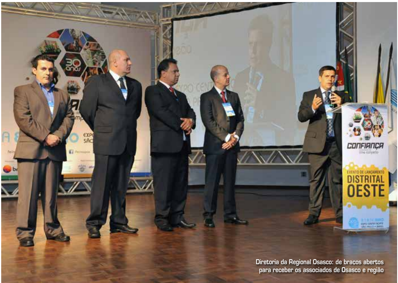
Diretoria da Regional Osasco: de braços abertos para receber os associados de Osasco e região

“Escolhemos Osasco porque grande parte dos associados da antiga Distrital Oeste está na cidade. Sem contar a questão da localização, uma vez que a nova sede fica bem perto do terminal rodoviário e de uma estação de trem. Isso facilita a vida dos colaboradores, que poderão participar ainda mais dos cursos da Escola APAS”, afirmou Carvalho. Segundo ele, as instalações vão agradar muito os supermercadistas, tanto pela beleza quanto pela praticidade. “O estacionamento é amplo e o shopping bem próximo pode ser visitado antes ou depois de um curso realizado na regional”.