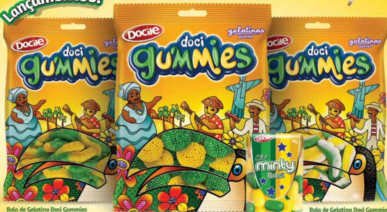
Bala de Gelatina Doci Gummies Cobrinhas Cítricas 80g e 300g