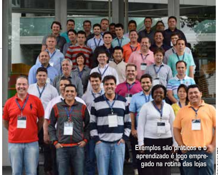
Exemplos são práticos e o aprendizado é logo empregado na rotina das lojas

Em uma das aulas, por exemplo, alguns participantes do curso apresentaram a melhor estratégia de diferenciação de suas