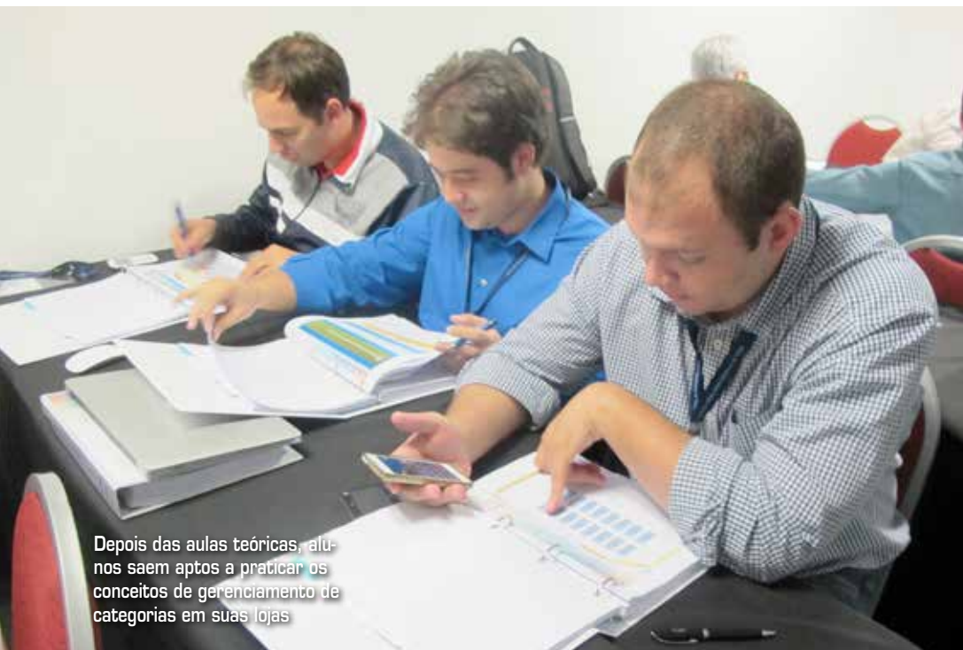
Depois das aulas teóricas, alunos saem aptos a praticar os conceitos de gerenciamento de categorias em suas lojas