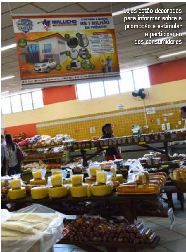
Lojas estão decoradas para informar sobre a promoção e estimular a participação dos consumidores

Além do site oficial www.promocaomarcascampeas.com.br , os associados podem esclarecer dúvidas com a agência parceira da APAS, a Star Trade, nos telefones (11) 2076-0133 e (11) 2337-9000, ou pelo e-mail: associados@promocaomarcascampeas.com.br .