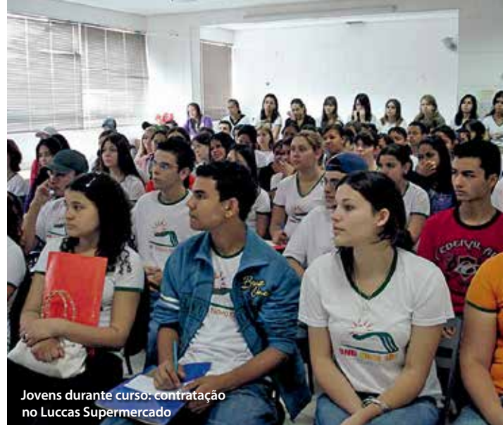
Jovens durante curso: contratação no Luccas Supermercado