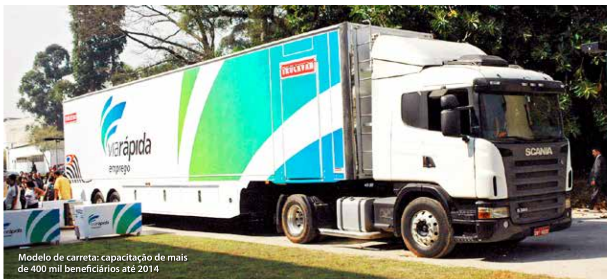
Modelo de carreta: capacitação de mais de 400 mil beneficiários até 2014

A oferta de cursos do Via Rápida é baseada em avaliações permanentes da demanda, feitas com informações do Emprega São Paulo, Cadastro Geral de Empregados e Desempregados (Caged), além de diagnósticos regionais elaborados pela Fundação Seade.