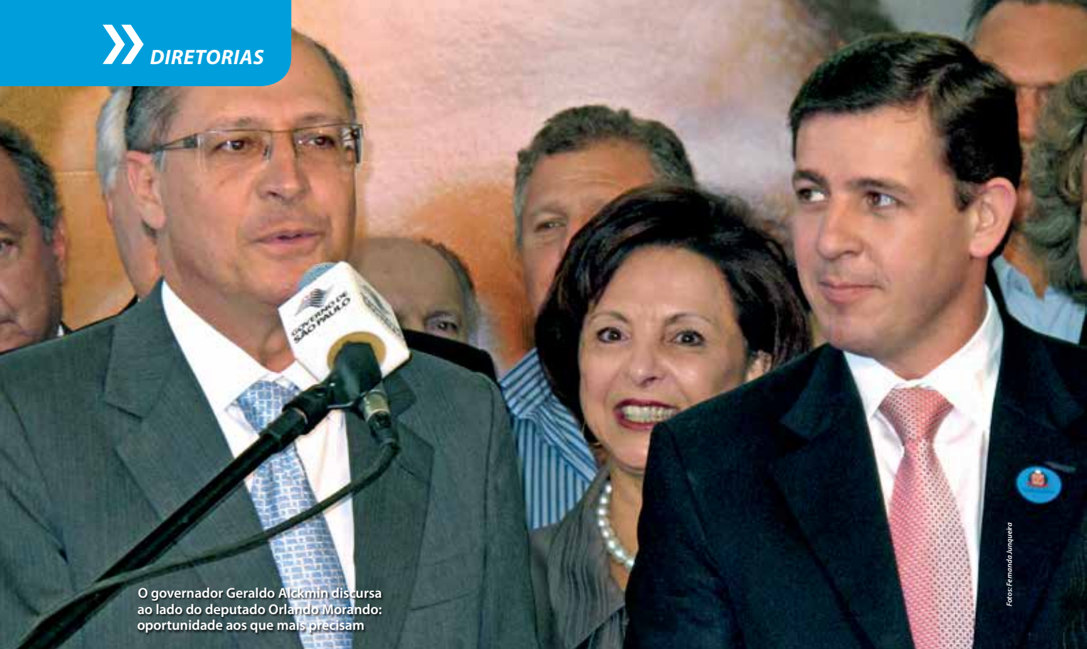
O governador Geraldo Alckmin discursa ao lado do deputado Orlando Morando: oportunidade aos que mais precisam