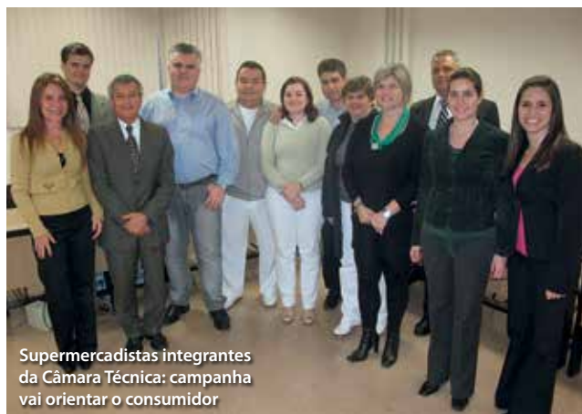
Supermercadistas integrantes da Câmara Técnica: campanha vai orientar o consumidor

O consumidor nem estava lá, mas foi o assunto principal da reunião da Câmara Técnica do Comércio Supermercadista, composta por integrantes da APAS – associados supermercadistas – e do Procon-SP. O encontro, realizado no dia 2 de agosto, na sede do Procon-SP, tratou sobre a medida compensatória que oferece uma garantia inovadora ao consumidor. Se encontrar produto vencido na gôndola, o consumidor receberá uma unidade igual ou similar no prazo de validade gratuitamente. Foi discutida na reunião a criação de uma campanha educativa para orientar o consumidor. Os colaboradores das lojas serão treinados e a APAS vai elaborar um vídeo para instruí-los. “Há uma mobilização de todo o setor. A medida compensatória é uma revolução, uma mudança