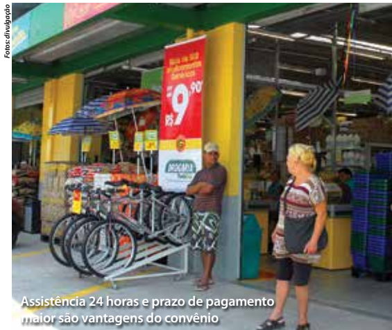
Assistência 24 horas e prazo de pagamento maior são vantagens do convênio

Convênios com as seguradoras Generalli e Yasuda, que estão entre as mais importantes do País, foram renovados em julho