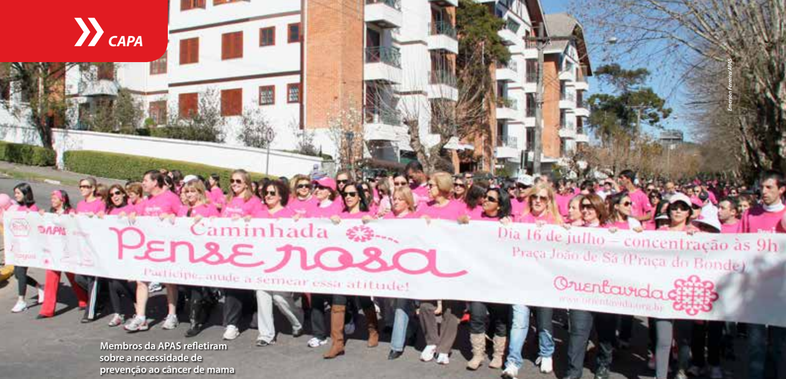
Membros da APAS refletiram sobre a necessidade de prevenção ao câncer de mama