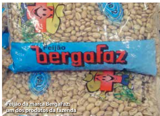
Feijão da marca BergaFaz: um dos produtos da fazenda