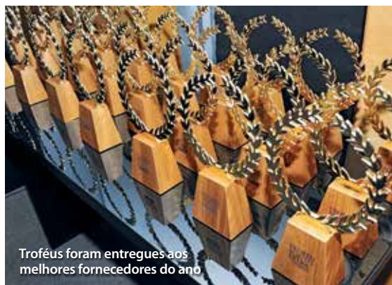
Troféus foram entregues aos melhores fornecedores do ano