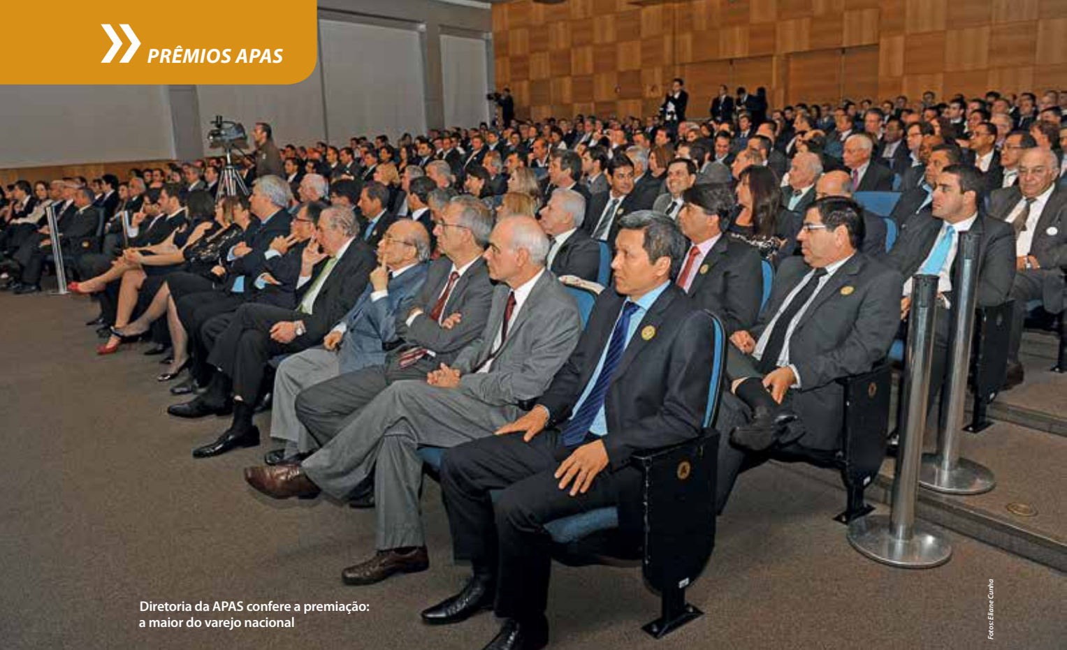
Diretoria da APAS confere a premiação: a maior do varejo nacional