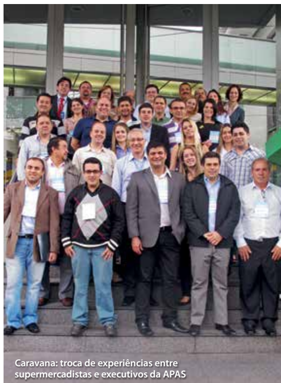
Caravana: troca de experiências entre supermercadistas e executivos da APAS

A Caravana é uma ação da Diretoria de Apoio e Relacionamento com o Associado, que visa proporcionar uma experiência agradável e descontraída aos associados, agregando conhecimentos e aprimorando ainda mais o seu relacionamento com a entidade.