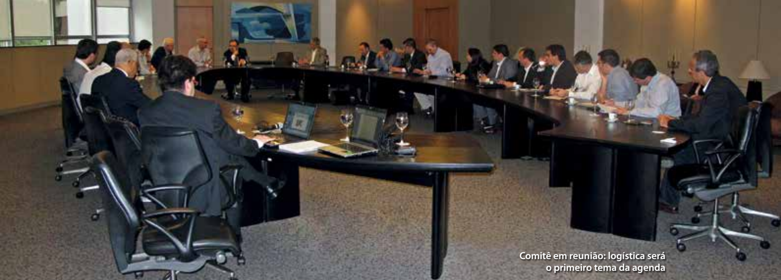
Comitê em reunião: logística será o primeiro tema da agenda