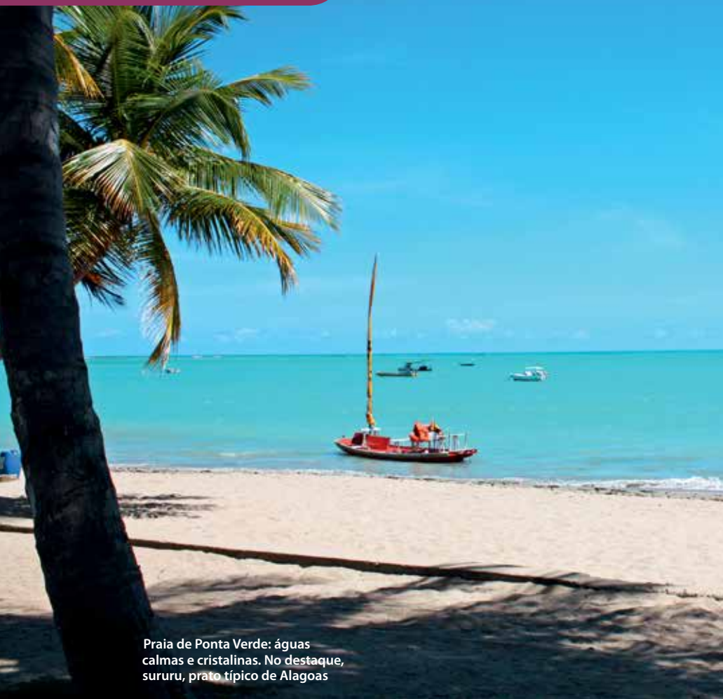
Praia de Ponta Verde: águas calmas e cristalinas. No destaque, sururu, prato típico de Alagoas