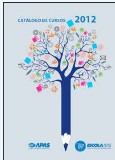
Catálogo de cursos: novidades em 2012