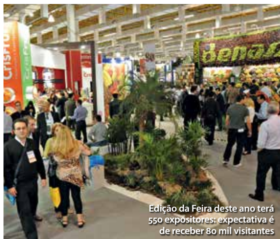
Edição da Feira deste ano terá 550 expositores; expectativa é de receber 80 mil visitantes

A Feira APAS é o evento mais importante do setor de supermercados no mundo. Os visitantes vêm de todo