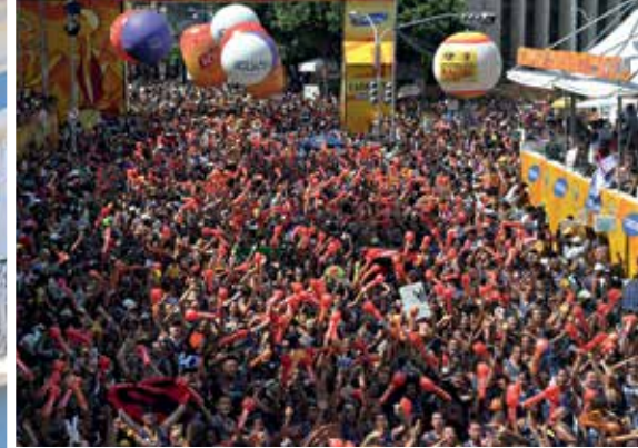
Pelourinho: um dos lugares mais famosos da Bahia. No destaque, trio elétrico que encanta no Carnaval