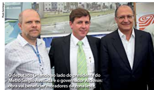
O deputado Orlando ao lado do presidente do Metrô Sérgio Avelleda e o governador Alckmin: obra vai beneficiar moradores da zona leste.