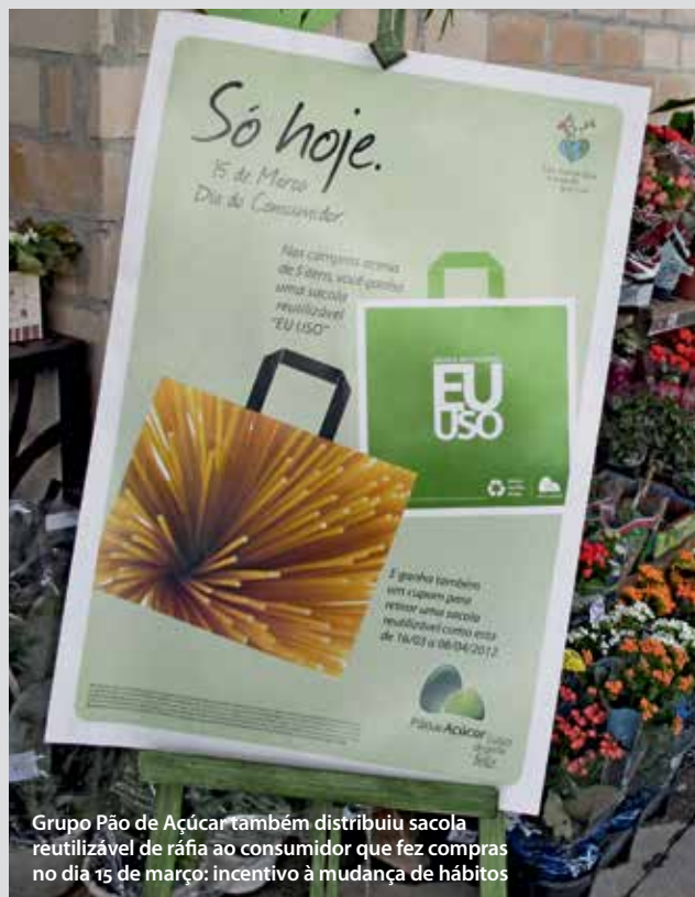
Grupo Pão de Açúcar também distribuiu sacola reutilizável de rafia ao consumidor que fez compras no dia 15 de março: incentivo à mudança de hábitos