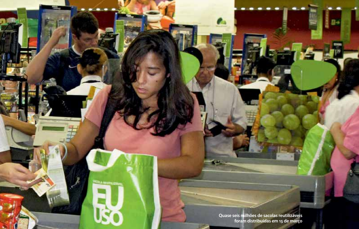
Quase seis milhões de sacolas reutilizáveis foram distribuídas em 15 de março

esclarecimentos. O que se vê hoje, na prática, são pessoas adequando-se a um cenário que já é comum no exterior – cada um levando a própria sacola para fazer compras.