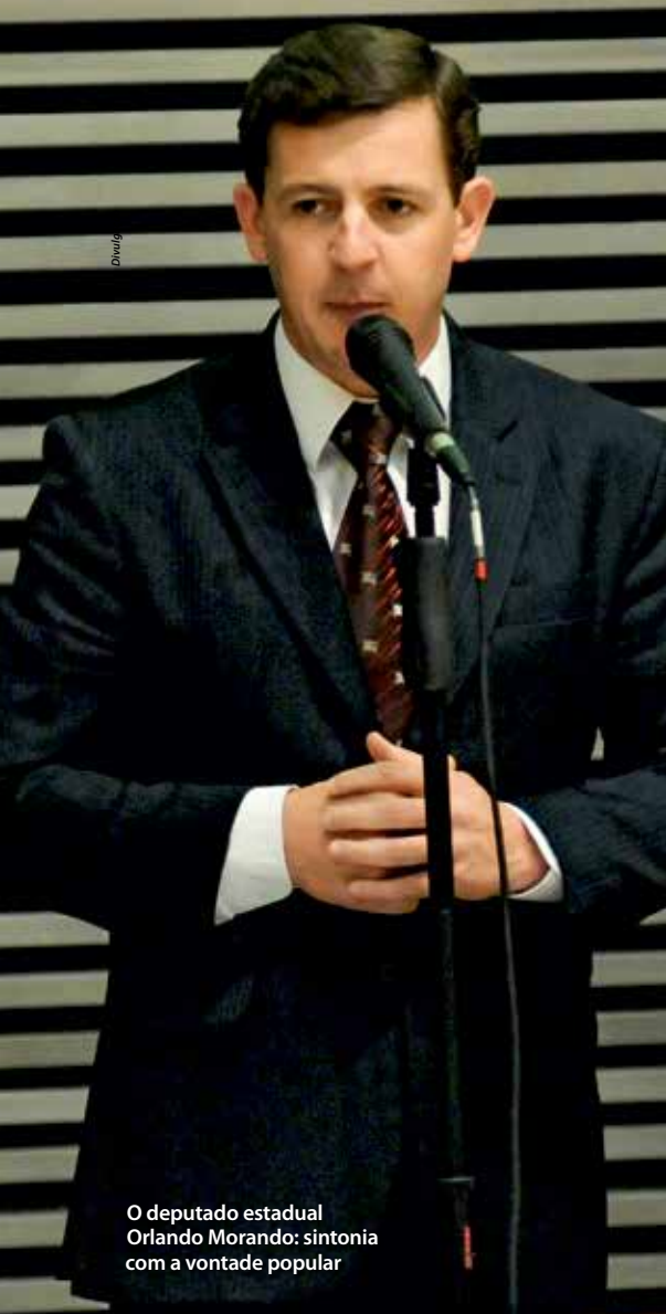
O deputado estadual Orlando Morando: sintonia com a vontade popular