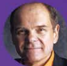
DON TAPSCOTT Moxie Insight

MACROWIKINOMICS: COLABORAÇÃO E A TRANSFORMAÇÃO DO MARKETING