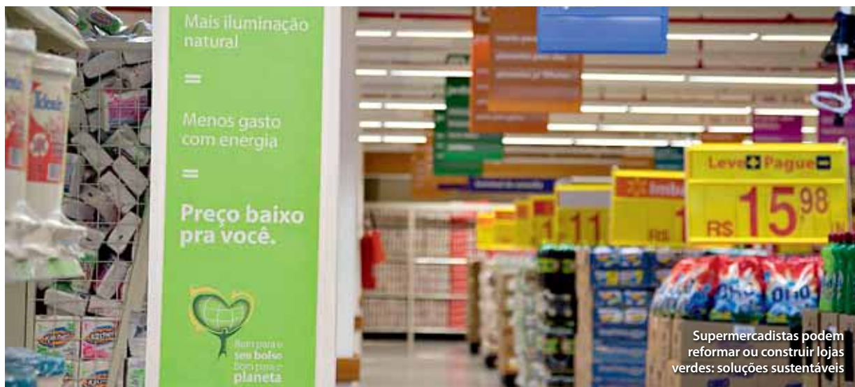
Supermercadistas podem reformar ou construir lojas verdes: soluções sustentáveis