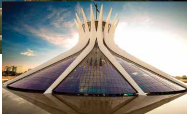
Vista aérea da capital federal. No destaque, a Catedral Metropolitana: obra de Niemeyer

O conjunto arquitetônico, urbanístico e paisagístico rendeu à capital o título de Patrimônio Cultural da Humanidade, o único concedido a uma cidade moderna. Brasília foi projetada pelo arquiteto Oscar Niemeyer, e a cidade planejada tornou-se a capital do Brasil em 1960. Nasceram o Palácio do Planalto, do Itamaraty, da Alvorada, o Jaburu e o Congresso Nacional. Em seguida, as curvas deram a cara moderna de Brasília: vieram a