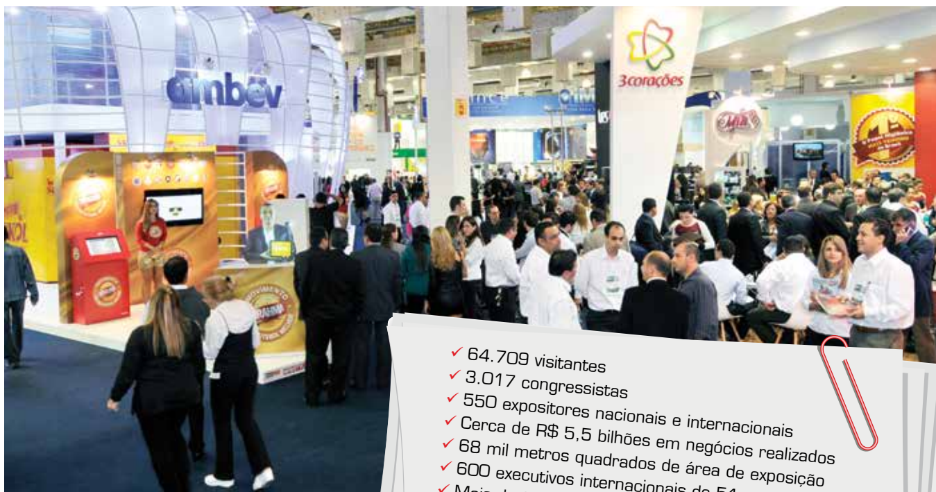
Cerca de 65 mil empresários do Brasil e de outros países visitaram a Feira