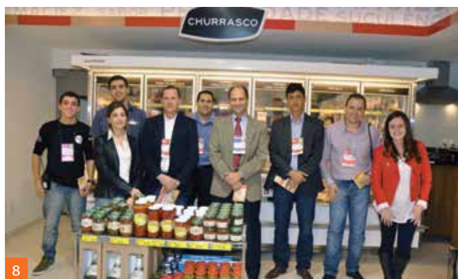
1. Equipe da empresa expositora Santa Helena