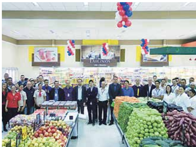
Diretoria e colaboradores celebram a reinauguração da loja