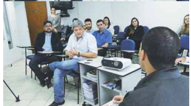
Associados detalharam os maiores desafios do setor supermercadista

Vale do Paraíba: Thomazzini, Empório Simpatia, Max Vale e Mercadinho Piratininga.