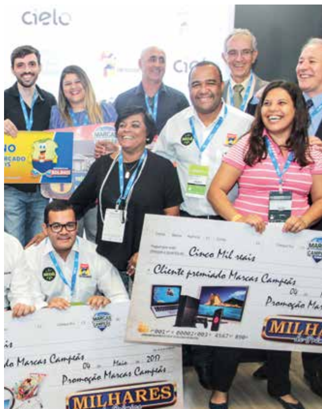
Capa ..... pág. 8 Entrega de prêmios aos vencedores da Marcas Campeãs