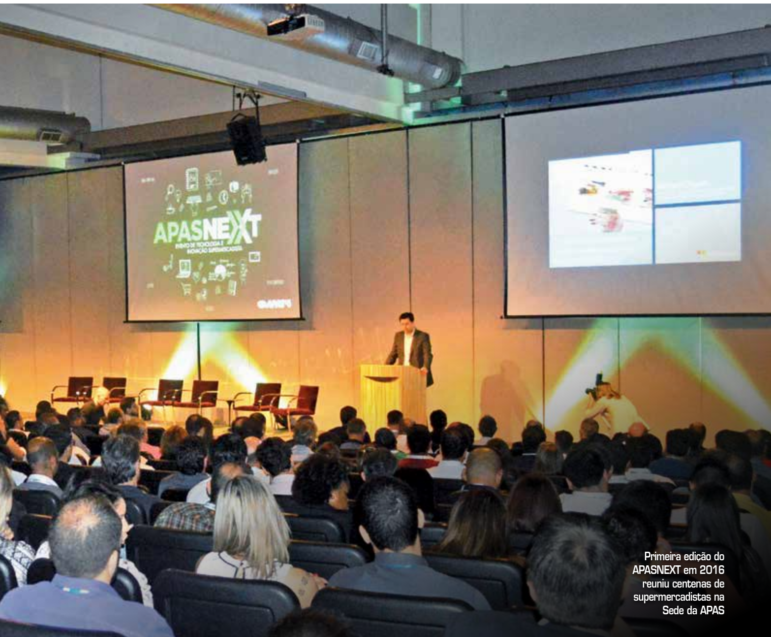
Primeira edição do APASNEXT em 2016 reuniu centenas de supermercadistas na Sede da APAS

sugestões, entre em contato com a Central de Atendimento APAS, pelo telefone (11) 3647-5000.