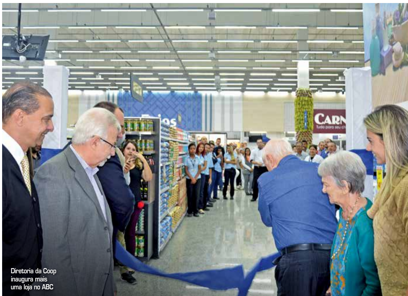
Diretoria da Coop inaugura mais uma loja no ABC

Conheça nesta edição da Acontece as principais ações institucionais e de relacionamento da APAS e também as recentes novidades, iniciativas e boas práticas dos associados e do setor supermercadista.