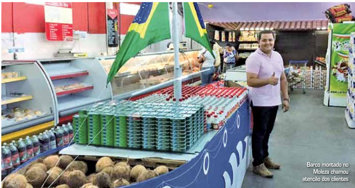
Barco montado no Moleza chamou atenção dos clientes