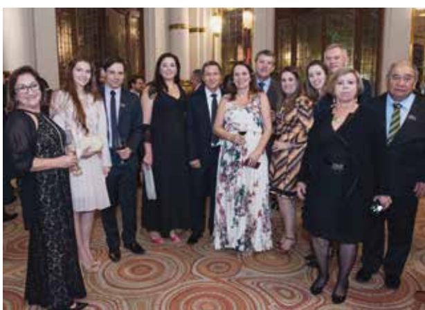
Diretores da APAS