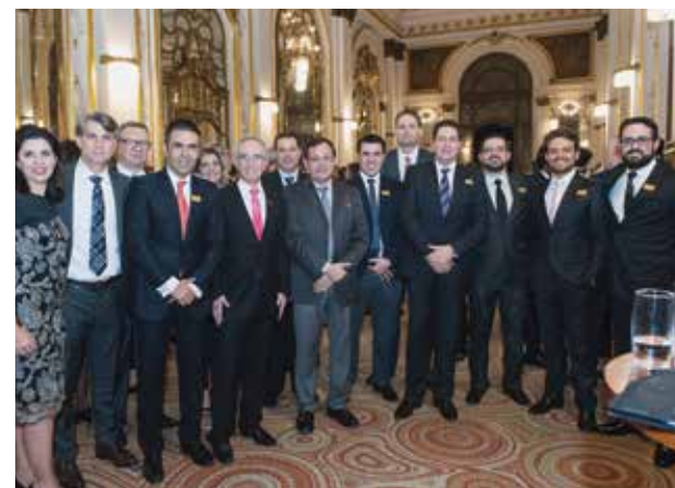
Diretores da APAS e representantes (Coca-Cola Femsa)