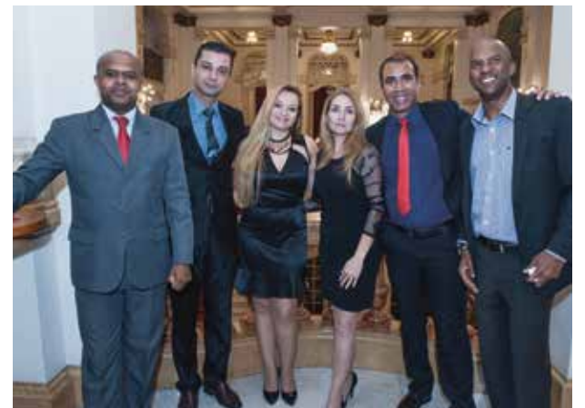
Representantes do Supermercado Avenida 2