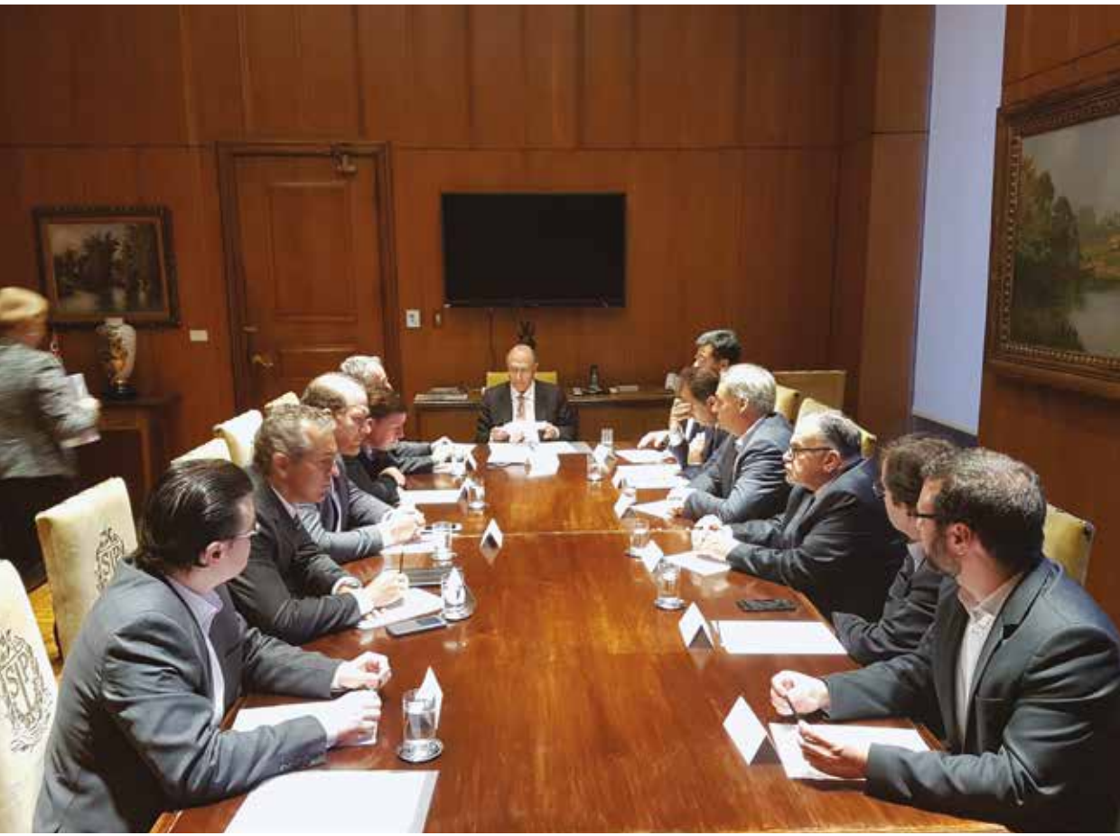
DIRETORIA DA APAS É RECEBIDA PELO ENTÃO GOVERNADOR GERALDO ALCKMIN, NO PALÁCIO DOS BANDEIRANTES