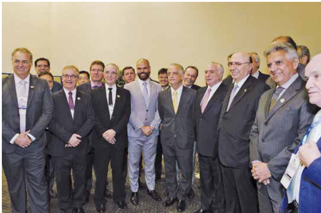
ENCONTRO DE DIRETORES DA APAS COM O PRESIDENTE DA REPÚBLICA, MICHEL TEMER, HENRIQUE MEIRELLES, O GOVERNADOR DO ESTADO, MARCIO FRANÇA, E O PREFEITO DE SÃO PAULO, BRUNO COVAS

Outro avanço institucional da APAS foi observado em relação à rotulagem de alergênicos promovida pela Anvisa. A nova regulamentação queria estender a obrigatoriedade de listagem de todos os produtos alergênicos e potencialmente alergênicos nas etiquetas de produtos produzidos nos supermercados. A determinação não era estendida, no entanto, a outros tipos de estabelecimentos que, diferentemente das indústrias, não possuem ambientes específicos para a produção de cada tipo de alimento. Com sua atuação técnica, a APAS conseguiu impedir que a medida fosse exigida no setor supermercadista.